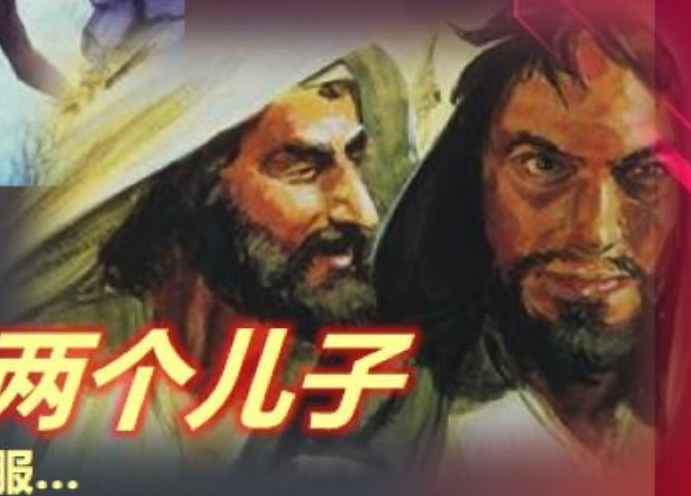
以利的两个儿子 因不相信和不顺服...