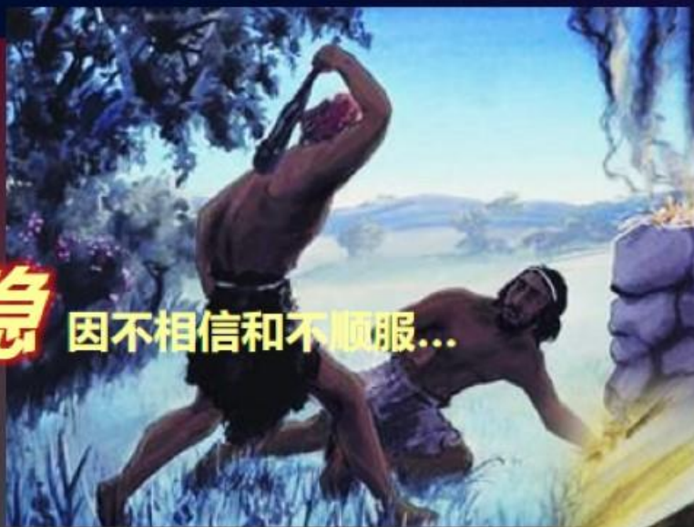
该隐 因不相信和不顺服...