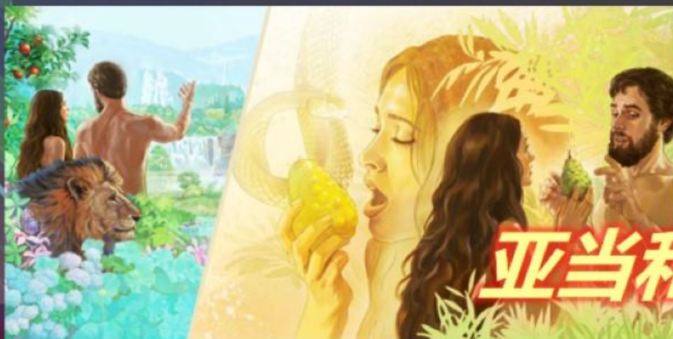
亚当和夏娃 因不相信和不顺服...