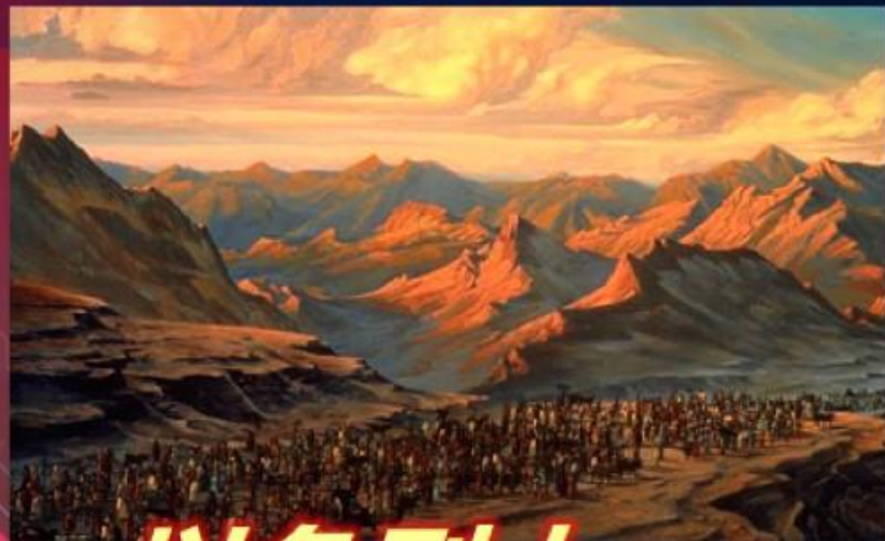
以色列人 因不相信和不顺服...